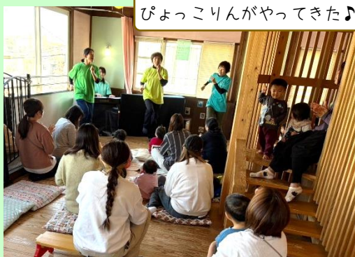
ぴょっこりんがやってきた♪

楽しい音楽や踊り、季節のお話に 大きいシフォンなどお楽しみいっぱい！ 見て聞いて身体を動かして楽しみました♪