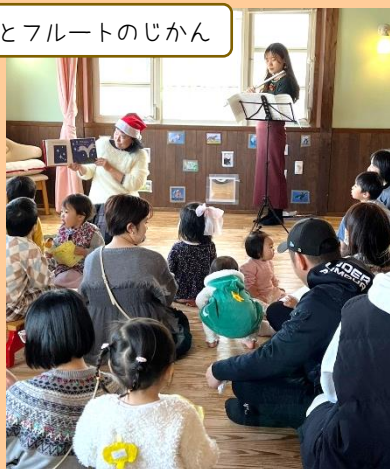
絵本とフルーツのじかん

クリスマスに開催された「絵本とフルーツのじかん」 1月の「ぴょっこりんがやってきた♪」 当日はたくさんの親子さんが楽しみに来てくれて いつもと違うぜいたくなじかんを過ごしました♪