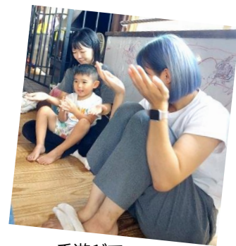
手遊びで リラックスタイム♪