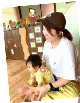
絵本で繋がる親子の コミュニケーション♪