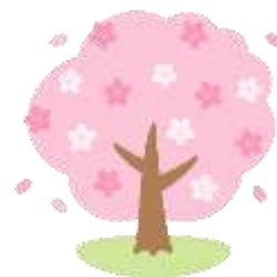
桜の下でみんな笑顔