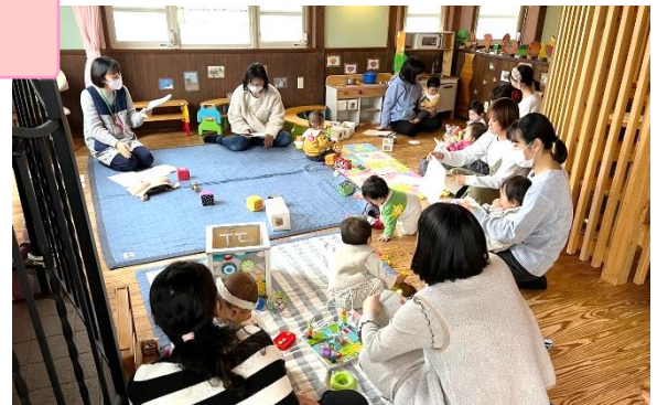
セルフチェックの方法などを教えてもらいました