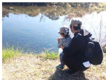
歩くのも眺めるのも楽しいね♪