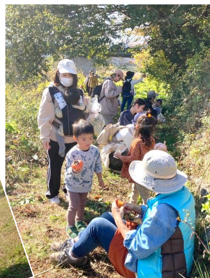
休憩しながらのんびりおさんぽ