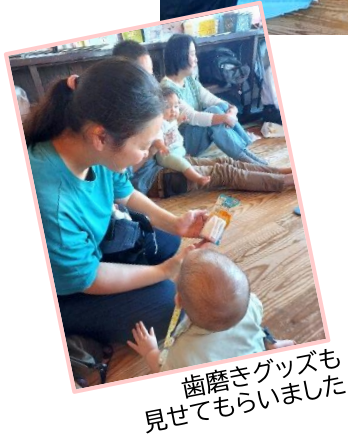
歯磨きグッズも 見せてもらいました