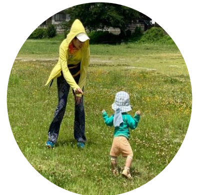
河原の道には、冒険と楽しい発見がいっぱいだったね♪