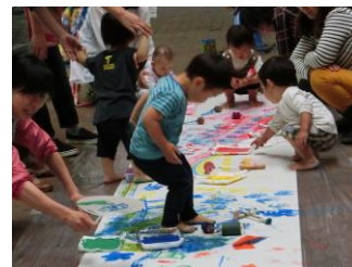
昨年のあおぞらおえかきより

夏祭りに展示するうちわの制作をします。着替えを持って、ママも汚れてもよい服装で、ぜひみなさん作りに来てください！